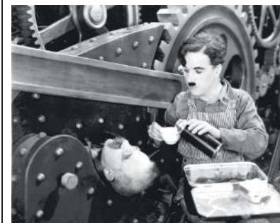
▲ Capolavoro “Tempi moderni”

Ancora un nuovo programma per Il Cinema Ritrovato Fuori Sala firmato dalla Cineteca di Bologna, che cuce insieme grandi classici e rarità, nelle versioni restaurate. Il cartellone sarà disponibile da domani e fino al 21 aprile, online su MYmovies, senza limiti di giorni o di orario, al 15 euro (ridotto 12). Protagonista è Chaplin, di cui si celebra il compleanno il 16 aprile, con un poker di film, dai capolavori “Tempi moderni” e “Il grande dittatore” a “Monsieur Verdoux” e “Luci della ribalta” abbinati a quattro comiche degli anni Dieci. Ma il 22 marzo è anche il centenario della nascita di Nino Manfredi, di cui viene riproposto “Pane e cioccolata”, lungometraggio sull'emigrazione italiana in Svizzera, diretto da Franco Brusati. La Cineteca si unisce poi alle celebrazioni dantesche col kolossal dell'epoca muta “L'inferno”, girato nel 1911, in programma dal 25 marzo per il Dantedì. Tra le riscoperte, “Les Enfants du Paradis” nella versione integrale, il film leggendario di Marcel Carné e Jacques Prévert, sul mondo meraviglioso e scomparso della Parigi ottocentesca, il Boulevard du Crime con i suoi commedianti, ladri e poeti assassini, e una delle più strazianti storie d'amore mai raccontate.